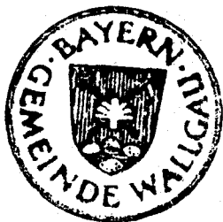
Hirtreiter 1. Bürgermeister